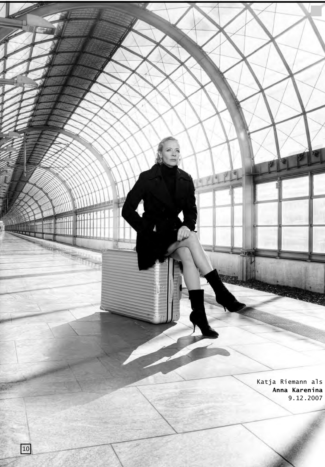
Katja Riemann als Anna Karenina 9.12.2007