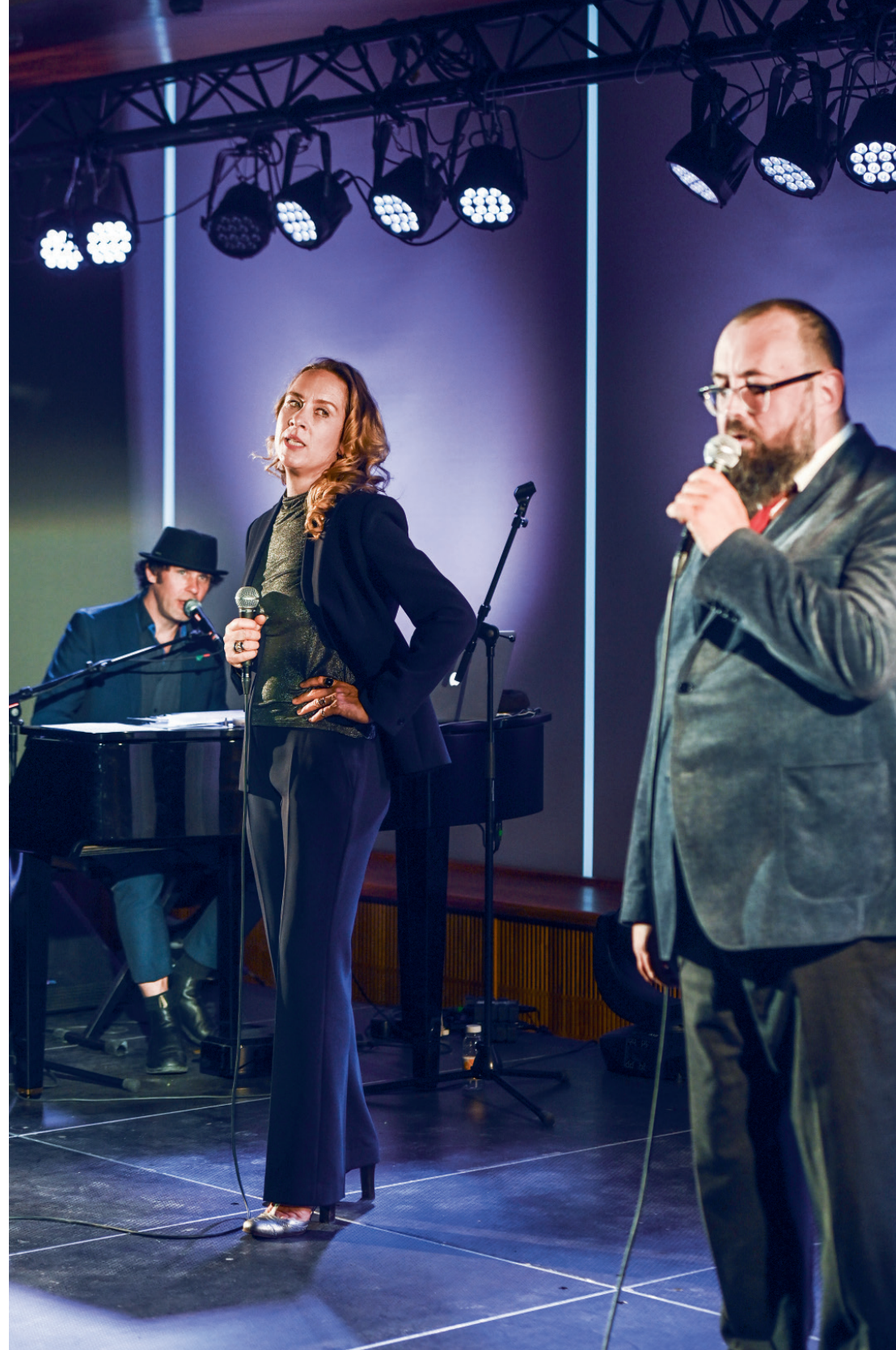
25 WORST SONGS